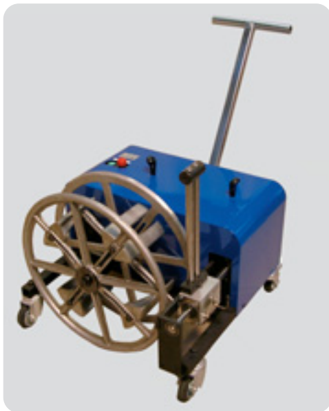
Devanadera para desguarnecido